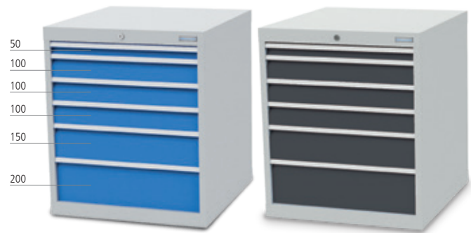
■ 6 x Schublade