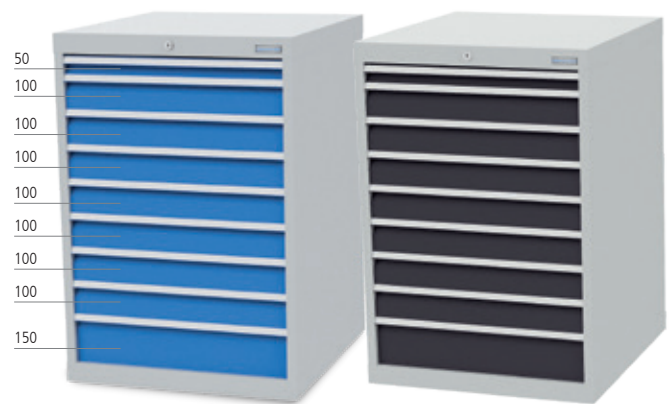
■ 9 x Schublade