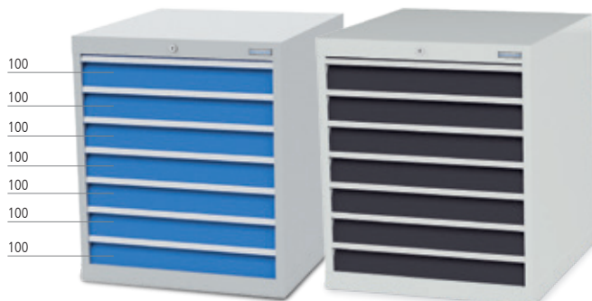
■ 7 x Schublade